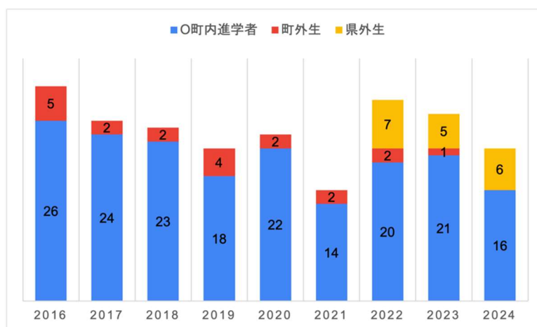
図1: O高校の入学者数の推移 (O町教育委員会提供資料を筆者により作成)

これら文科省事業と内閣府事業により高校と地域の協働は進んだ。成果として、①地域資源を活用したカリキュラム開発による生徒の自己肯定感の回復や資質能力の向上(阿部剛志、喜多下悠貴、永野恵 2022)、②県外生受け入れによる地元生、県外生双方への地元肯定感の向上 9) 、③部活動の廃止と地域移管による高校教職員の働き方改革の推進、④3年間在籍する県外生の受け入れによる統廃合検討ラインである入学定員1/2の確保がなされている(図1)。